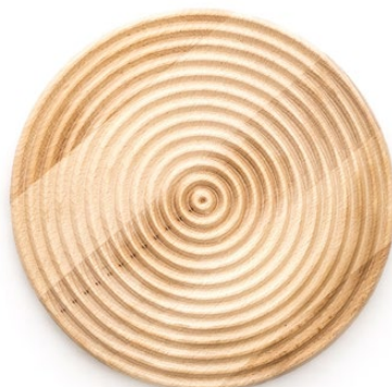
Art. Nr.: PR-DE-346 • okrogli ZEN • \varnothing 260 \times 20 mm • 1000 g • bukev • surova